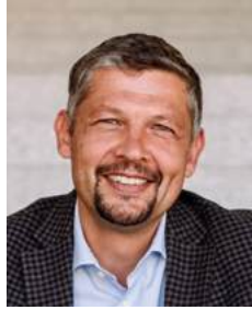
DANIEL ALFREIDER Landesrat für Infrastruktur und Mobilität

Ich wünsche Ihnen einen entspannten Urlaub und gute Fahrt mit südtirolmobil!